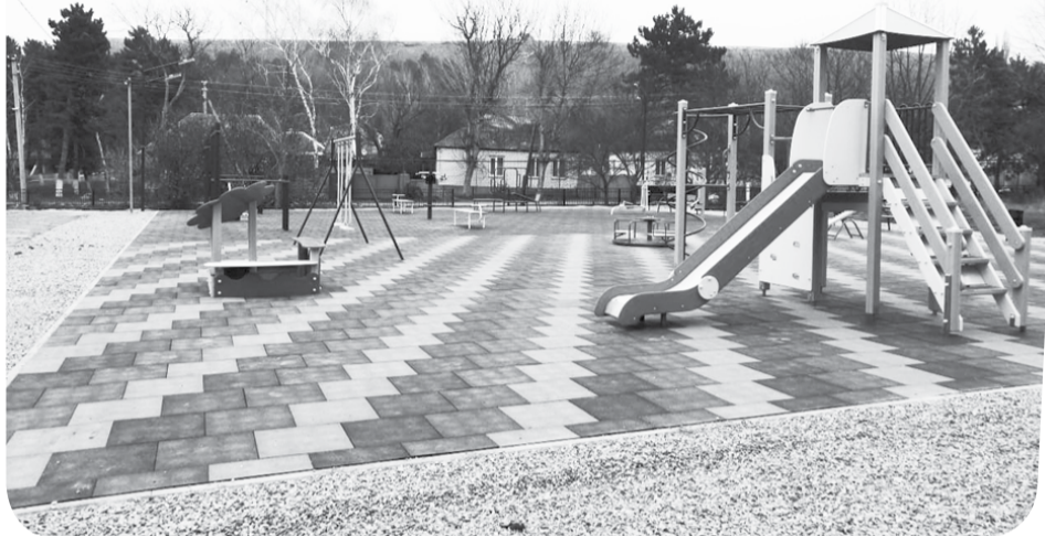
Готовый объект в рамках реализации программы в одном из посёлений Ставрополья.

В подпрограмму «Современный облик сельских территорий» вошло также 15 объектов из четырёх округов: Александровского, Изобильненского, Предгорного и Туркменского. В её рамках в регионе отремонтировали шесть учреждений образования и культуры, приобрели два школьных автобуса, построили три новых детских сада общей вместимостью 375 мест и две спортплощадки.