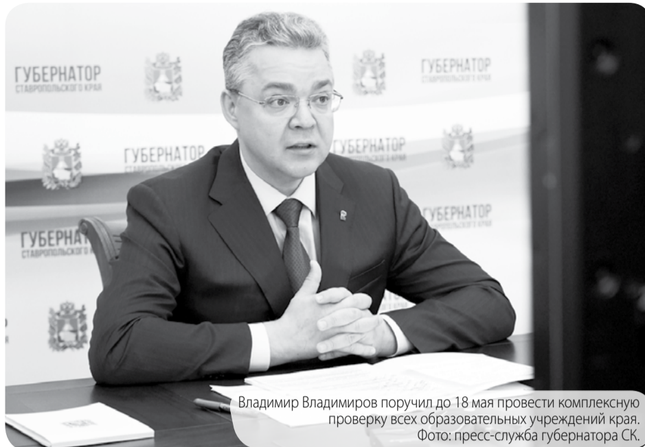
Владимир Владимирович поручил до 18 мая провести комплексную проверку всех образовательных учреждений края.

Они должны чётко понимать, как действовать в случае чрезвычайных ситуаций, - поставил задачу Владимир Владимирович.