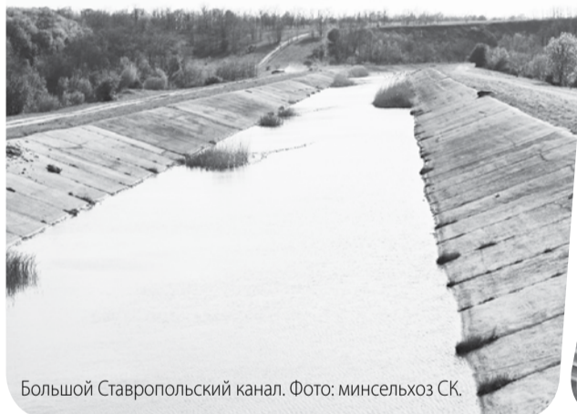
Большой Ставропольский канал.

За счёт реализации инвестиционных проектов в сельхозорганизациях и завершения строительства БСК-4 регион сможет увеличить площади орошения до 200 тысяч га. Четвёртая очередь канала даст краю 78 тысяч га новой мелиорации и обеспечение водой 160 тысяч человек. Но важно