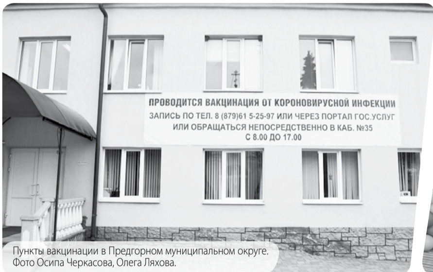
Пункты вакцинации в Предгорном муниципальном округе.

Всего в край поступило 269 тысяч компонентов вакцин от коронавируса. Последняя партия получена 4 мая. В ближайшее время ожидается поставка ещё более 9 тысяч доз вакцин.