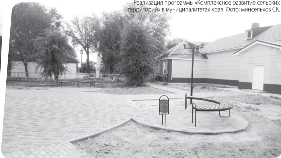
Реализация программы «Комплексное развитие сельских территорий» в муниципалитетах края.