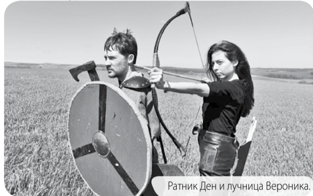
Ратник Ден и лучница Вероника.

Аналитический центр команды «Бештаунит» провел поход с использованием элементов исторической реконструкции. Цель проекта: окунуться в атмосферу средневековья и подметить стилевые особенности на практике; увидеть и облегчить создание художественных образов для сериала «Ратибор: хранитель Севера», многие сцены из которого снимаются на фоне красивых пейзажей Предгорья; на собственном опыте проверить ощущения и воссоздание суровой жизни средневековья.