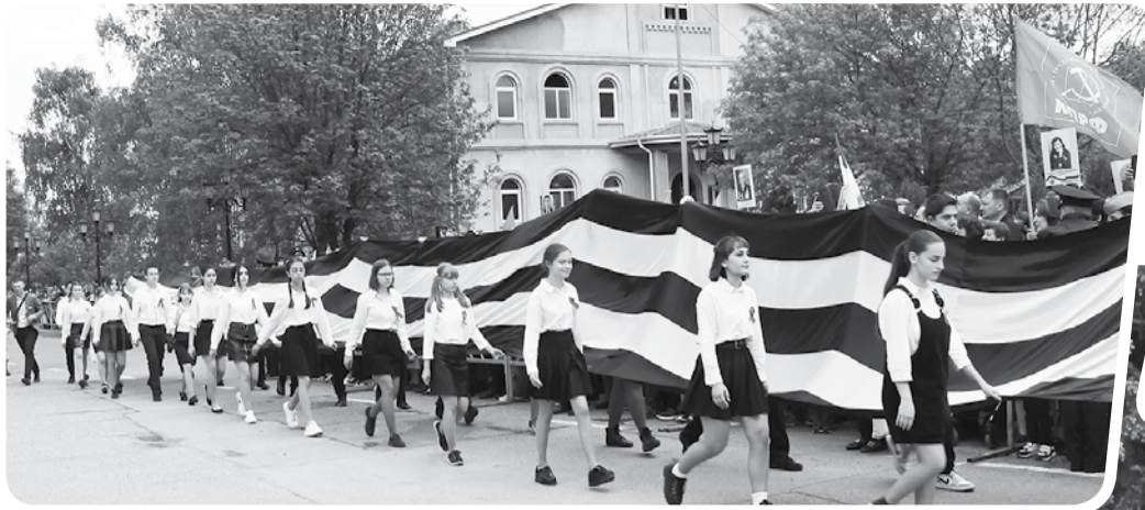
76 ЛЕТ ВЕЛИКОЙ ПОБЕДЫ