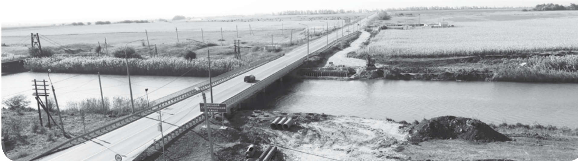
Строительные работы на магистральном канале БСК.

Республику на общей площади 2,5 млн га. Назначение канала - комплексное орошение земель, водоснабжение городов Кавминводской группы, Невинномысска, Черкесска и других населённых пунктов, а также промышленных комплексов, гидроэлектростанций и хозяйств рыбного промысла.