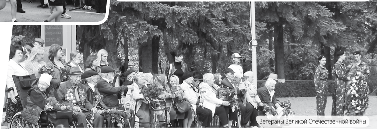
Ветераны Великой Отечественной войны